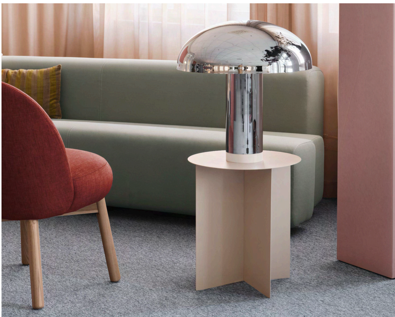
Projekt: Preem

På följande sidor hittar du mer detaljerad information om skötsel, rengöring och underhåll av textila golv. Välkommen att kontakta oss om du har frågor eller önskar ytterligare vägledning.